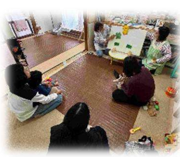
パネルシアターの日もあります