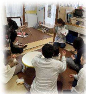
この日はみんな大好きな 「だるまさん」の読み聞かせ

毎日11：45と14：45に♪パンダうさぎコアラ♪で始まるひととき 「今日は何かな～？」とワクワクしている子どもたちの笑顔が素敵です！