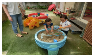
お庭でお砂遊びもできます☆