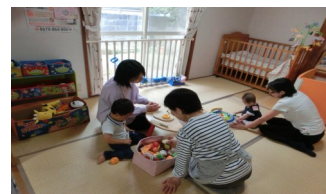
和室もあって、親子でほっとできま〜す♡