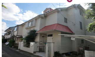
赤い屋根のおうちです♪