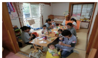
みんなでいただきます♪