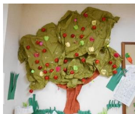
壁面飾りが 秋のりんごの木になり ました。

※ひろばの入室制限は解除されていますが、入室の際は、周りの方と1m以上間隔を 取っていただくなど譲り合ってください。 ※入室時の検温等、引き続きご協力お願いいたします。