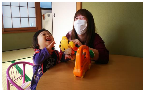
「ある日の一時預かりの様子」