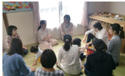
保健所の栄養士さんに幼児食の話や離乳食の話をしていただいた日