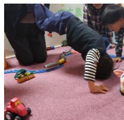
ボクがトンネルになった日