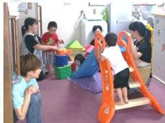
おべり合にチャレンジした日